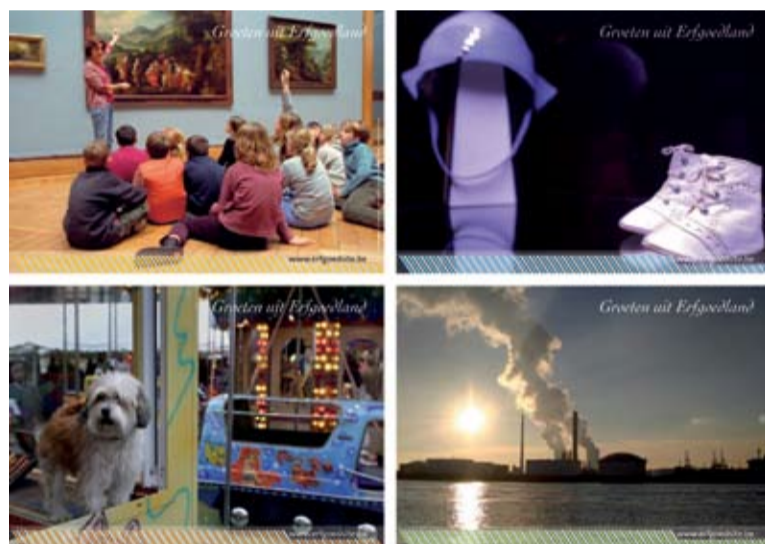
Liefhebbers kunnen hun vrienden op Erfgoedland attenderen door ze een briefkaart te sturen

Onderweg komt de bezoeker veel te weten over het cultureel erfgoed in al zijn vormen (mensen, dingen, verhalen, plaatsen). Erfgoed getuigt namelijk niet alleen in zijn fysieke vorm van het verleden, maar ook via verhalen, rituelen en tradities die