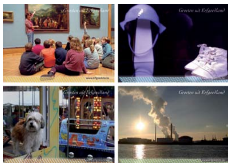
Liefhebbers kunnen hun vrienden op Erfgoedland attenderen door ze een briefkaart te sturen

Onderweg komt de bezoeker veel te weten over het cultureel erfgoed in al zijn vormen (mensen, dingen, verhalen, plaatsen). Erfgoed getuigt namelijk niet alleen in zijn fysieke vorm van het verleden, maar ook via verhalen, rituelen en tradities die