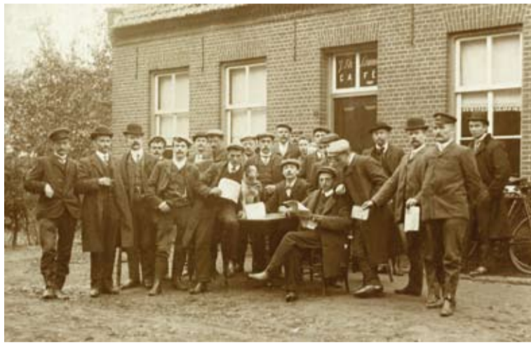
Christelijke Werkliedenvereniging 'De Eendracht' in Eindhoven, rond 1907.

Aan het eind van de negentiende en in het begin van de twintigste eeuw richtten veel arbeiders vakverenigingen, werkliedenverenigingen of verwante organisaties op. Een werkliedenvereniging richtte zich wat minder op strijd met de patroons dan de meeste vakverenigingen, maar probeerde toch de belangen van de arbeiders te behartigen - in dit geval niet de stoffelijke, maar vooral de geestelijke. Dergelijke verenigingen werden plaatselijk opgericht, door arbeiders die elkaar kenden. Vaak werden ze later de afdeling van een landelijke organisatie, die bijvoorbeeld cao's voor het hele land kon afsluiten. Het omgekeerde kon echter ook gebeuren: een landelijke organisatie besloot dat de arbeidsverhoudingen in Eindhoven er om vroegen dat de