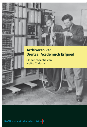
Archiveren van Digitaal Academisch Erfgoed Onder redactie van Heiko Tjalsma

Zowel het NHDA als het Meertens Instituut heeft concrete resultaten met het project behaald. Voor het Meertens Instituut zijn niet alleen belangrijke databestanden behouden gebleven die anders verloren waren gegaan, maar ze zijn ook gedocumenteerd en daardoor beter bruikbaar. Het NHDA heeft geleerd hoe je digitale retroarchivering aan moet pakken. Er is een standaard ADA-aanpak in zeven fases gedefinieerd die in de publicatie wordt beschreven, en die nu door DANS wordt aangeboden. DANS heeft de ADA-aanpak gebruikt in het project 'e-depot Nederlandse Archeologie' en onderzoekt met welke andere kandidaten een ADA-project kan worden opgestart. (Luuk Schreven)