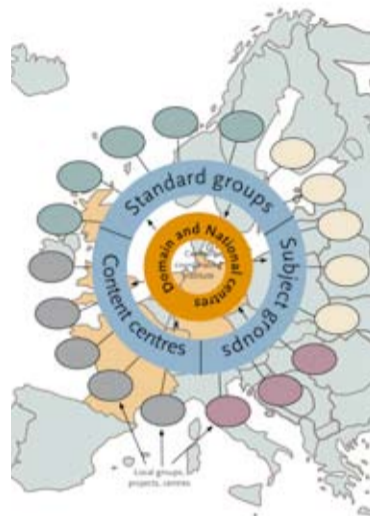
Infrastructuur volgens de informatiebrochure

Initiatiefnemers van DARIAH zijn behalve DANS drie andere insti-