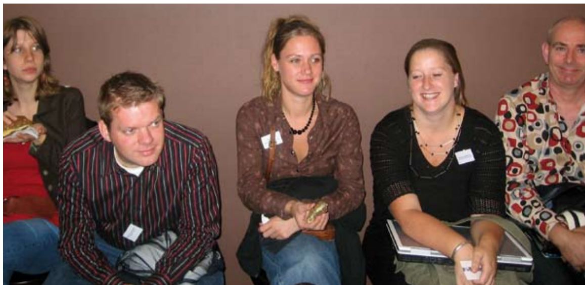
Wachten op een date bij de DEN subsidieworkshop

Fondsen werven is een specialisme met eigen websites, vakbladen, en consultants. Maarten de Vries, één van die consultants, schatte dat gemiddeld 25% van de verkregen subsidies moet worden besteed aan de verwerving van de subsidie. De 'terugtrekkende' overheid heeft een grotere rol voor particuliere geldgevers tot gevolg. Aanvragers moeten in zijn visie het sociale profijt van de gevraagde investering benadrukken, bijvoorbeeld door het berekenen van een 'schaduwprijs' of een voorstel