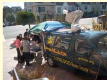
De Bookmobile in San Fransisco

de bedoeling om de wet te overtreden. Wel trouwens om die wet ter discussie te stellen. De eerste Internet Bookmobile, een initiatief van