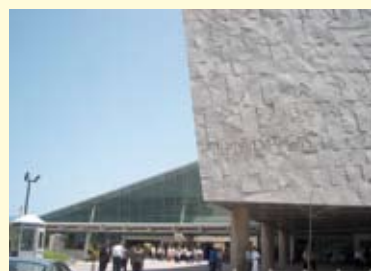
De bibliotheek van Alexandrië, naar verluidd uitvalsbasis van een Bookmobile

Intussen zijn er initiatieven geweest om Bookmobiles de weg op te krijgen in gebieden in de wereld waar de kinderen minder zakgeld krijgen dan rond de San Fransisco Bay. Met geld van het Internet Archive en de Wereldbank start er een mobiel in het Egyptische Alexandrië – een plek van symbolische betekenis omdat in deze stad immers in de oude tijd