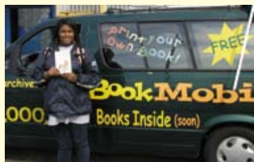
Vrouw met verse print van The Wizard of Oz in Washington DC

de overtuiging van bibliothecarissen en subsidiegevers dat er altijd wel mensen aan het lezen gebracht kunnen worden die de bibliotheek niet weten te vinden. Afgelopen zomer waren de rijdende bibliotheken weer te zien op de stranden van Den Haag, Katwijk, Monster en Brouwersdam. In Amerika heet zo iets een bookmobile . Een heel nieuw dimensiewerd erdaar aan toegevoegd door het internet, dat