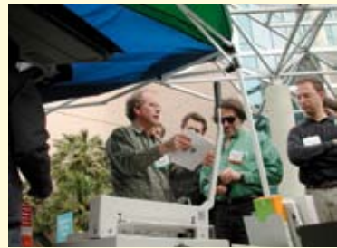
Archive-baas Brewster Kahle zelf is vaak standwerker bij de Bookmobile

Na die eerste demonstratieve tocht volgt een periode van ups en downs. De ups gekenmerkt door groot enthousiasme tot bijna religieuze gedrevenheid, de downs waar-