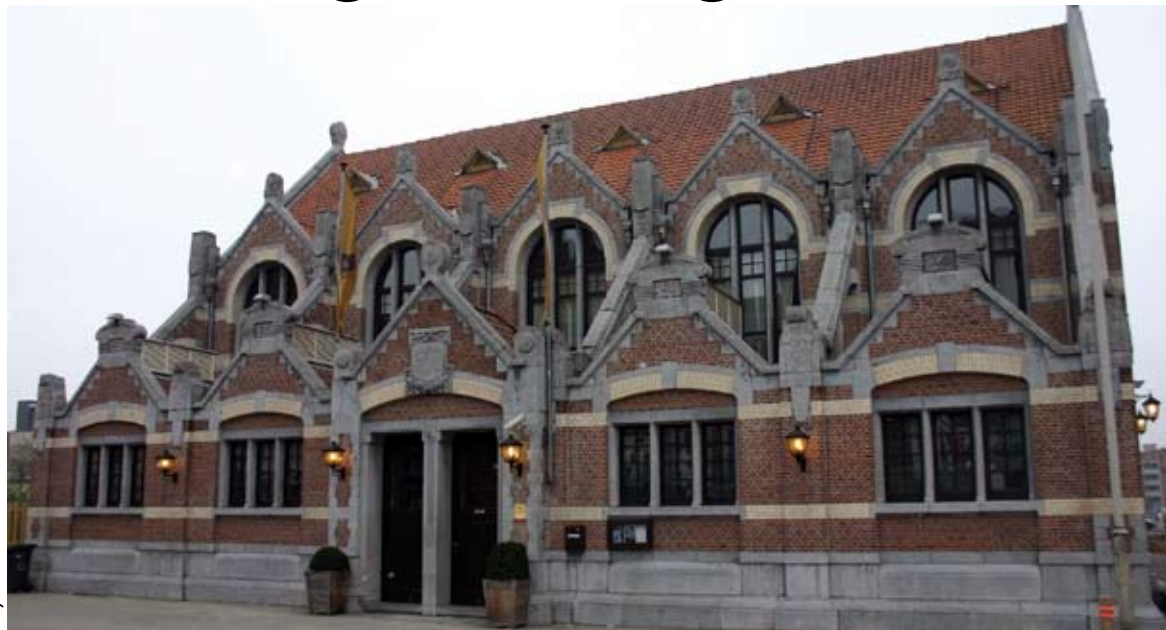
De Schuilplaats voor Werklieden te Antwerpen, op www.flickr.com geplaatst door erf-goed.be.

Erfgoed.be verzamelt foto's van beschermde monumenten, landschappen en dorpsgezichten op een interactieve kaart van Vlaanderen. Een klik op de kaart opent de foto met extra metadata. De bezoekers kunnen zelf een bijdrage leveren door foto's en metadata op te sturen, waarna een medewerker ze aan de kaart toevoegt. 'Tegenwoordig gebruikt de erfgoedconsument, net als iedereen, zoekmachines om informatie te vinden', aldus Vereen-