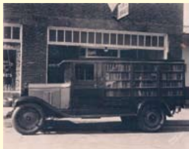
De Book Truck in Lexington, 1928

Zolang er bibliotheken bestaan, en auto's, zullen er waarschijnlijk ook rijdende bibliotheken zijn geweest. Fotografisch bewijs is er in elk geval van een Book Truck die in de jaren twintig rondom het Amerikaanse Lexington de leeshonger van de platelandsbewoners hielp stillen ( http://ils.unc.edu/nclibs/davidson ). Het verschijnsel is sindsdien niet meer verdwenen, in leven gehouden door