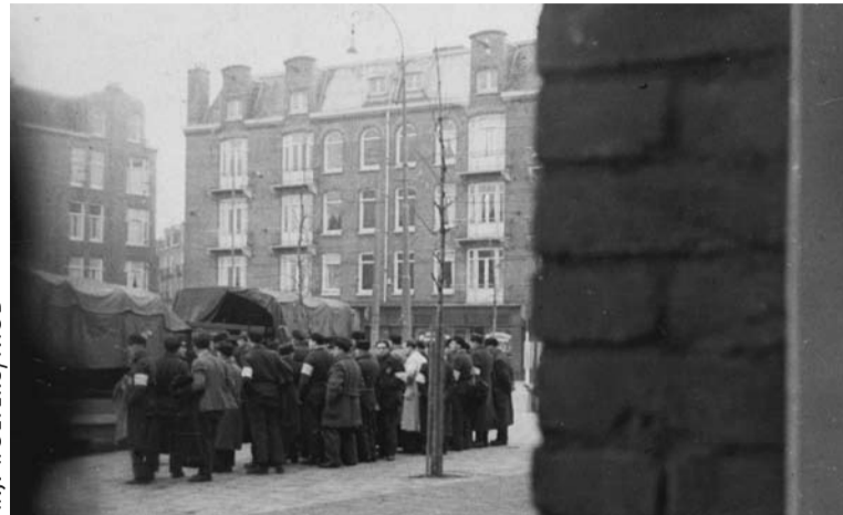
Razzia op het Amsterdamse Paul Krügerplein, 20 juni 1943.

gebruik van hoogwaardige opname-apparatuur voor een elk interview dient goed gedocumenteerd te worden. Transcripties maken de interviews inhoudelijk toegankelijk. Enkele belangrijke interviewcollecties zijn al laagdrempelig en open toegankelijk, maar voor veel andere geldt dat niet – ook los van privacybescherming en auteursrechten. Voor het project Getuigen Verhalen is de openbare toegang tot de interviews een belangrijke doelstelling. Daarom zal dat project een presentatie verzorgen op de studiedag Interviews uit de Kast die op 14 maart georganiseerd wordt (zie Agenda, p.2). (Rene van Horik)