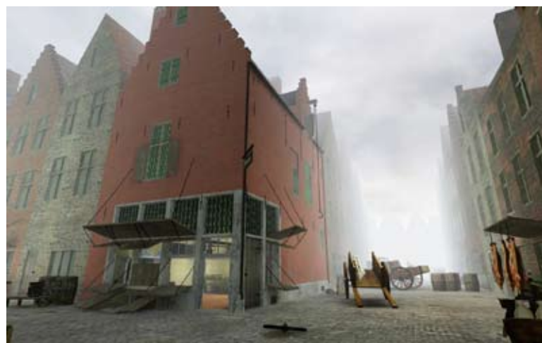
PLAYING THE PAST