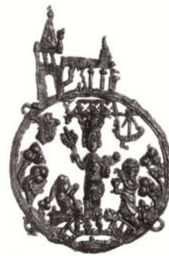
Insigne OLV van 's-Hertogenbosch, vindplaats: Nieuwlande. Bron: R.M. van Heeringen, A.M. Koldewij en A.A.G. Gaalman, Heiligen uit de modder. In Zeeland gevonden pelgrimstekens (Clavis Kunsthistorische Monografieën 4), Utrecht en Zutphen 1987, pp. 78-79, nr. 11.2

Alle 481 wonderverhalen uit het Bossche Mirakelboek (1382-1603), zijn aan de hand van de herkomstplaatsen van de pelgrims op een kaart gezet. Het patroon dat daaruit naar voren komt, is vergeleken met de patronen van Bossche insignes. Die vergelijking bevestigt de toepasbaarheid van geo-technologie in insigneonderzoek, maar ook het nut van de confrontatie met ander historisch bronmateriaal. Het mirakelboek-patroon vult het patroon van de uit 's Hertogenbosch meegenomen insignes aan: de kwetsbare metalen objecten worden namelijk enkel opgegraven in gebieden met een vochtige, luchtafsluitende bodem. Het patroon van de insignes die in 's-Hertogenbosch zijn gevonden, brengt een afwijking aan het licht: het verspreidingspatroon is veel groter dan dat van de eerdergenoemde insignes. De afstand die de reizende Bosschenaar wilde afleggen was klaarblijkelijk groter dan de afstand die de niet-Bosschenaar voor de Bossche Maria wilde overbruggen.