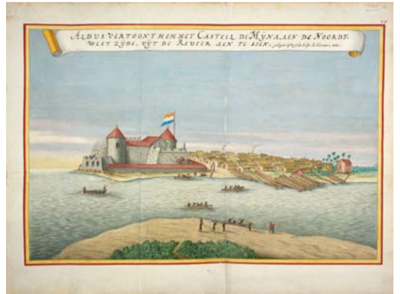
Gezicht op het West-Afrikaanse eiland Elmina, 17 e eeuwse kaart uit de Atlas Blaeu van der Hem

Het kangaan om notariële archieven, legt de Leidse historicus uit, of om archieven van zelfstandige ondernemers die op allerlei verschillende plaatsen opgedoken moeten worden. Ook een bron als de Middelburgse Commercie Compagnie, waarvan het Zeeuws Archief nog veel documenten heeft, levert belangrijke informatie op, bijvoorbeeld ladinglijsten en logboeken van vertrekkende schepen die aangeven met welke lading op welke havens wordt gevaren. 'Je moet op veel verschillende plaatsen zoeken om aan