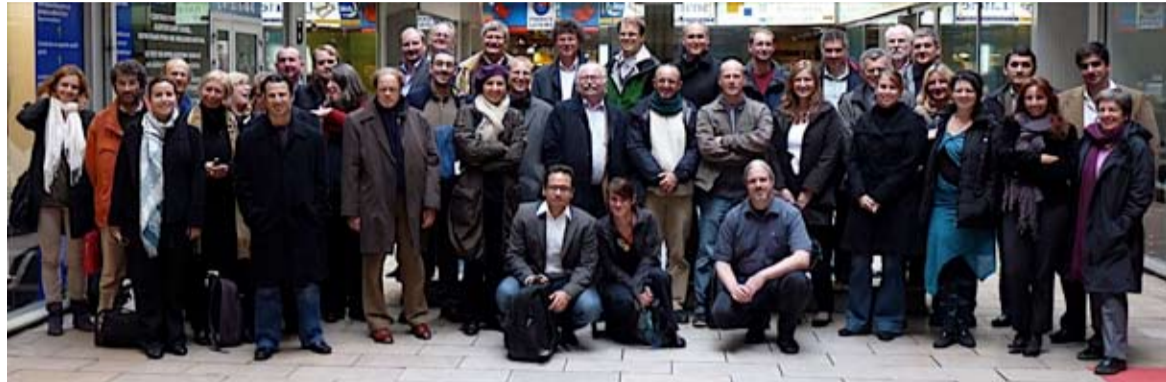
Groepsfoto van de conferentiegangers in Parijs

Op 19 en 20 oktober vond in Parijs een consortiumbijeenkomst plaats van het project DARIAH, Digital Research Infrastructure for the Arts and Humanities. Doel van het project is de bouw van een 'digitale werkbank' voor alfwetenschappers in Europa. Onderzoekers kunnen straks bij DARIAH terecht voor het vinden van data en tools, het archiveren van hun data, kennisuitwisseling en advies op het gebied van metadata en digitalisering.