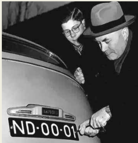
Eerste blauwe kentekenplaat (2 witte letters en 4 cijfers) in Nederland

Dit bestand bevat technische kenmerken en eigendomsinformatie over geregistreerde (weg)voertuigen in Nederland. De voertuigen zijn onderdeel van het actieve park en behoren aan natuurlijke personen. Voorbeelden zijn personenauto's, bestelauto's, bromfietzen, motorfietzen, vrachtwagens, autobussen en trekkers. De data zijn afkomstig uit het jaarbestand van de Rijksdienst voor Wegverkeer (RDW).