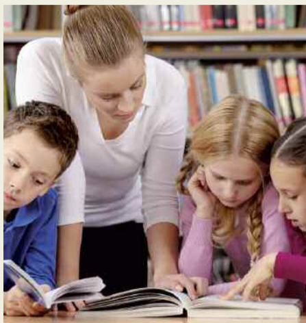
Kinderen helpen bij het leren lezen