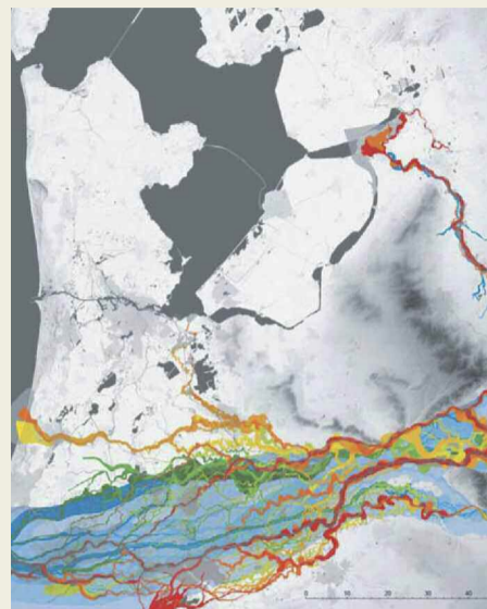
Rijn-Maas delta beeld UU

Deze dataset en beknopte toelichting bevat de reconstructie van de ontwikkeling van het netwerk van stroomgordels in de Rijn-Maas delta in het Holoceen. Op de Universiteit Utrecht wordt sinds 1999 een GIS bijgehouden waarin de reconstructie van het rivierennetwerk door de tijd wordt bijgehouden (K.M. Cohen, UU; Berendsen & Stouthamer, 2001; Berendsen, Cohen & Stouthamer, 2001; 2007). De hier gedeponeerde versie is geproduceerd in 2011-2012. Het betreft een volledige herziening en aanzienlijke uitbreiding van het eerder gekarteerde gebied. Een valorisatie subsidie van NWO-ALW, aangevuld met financiering