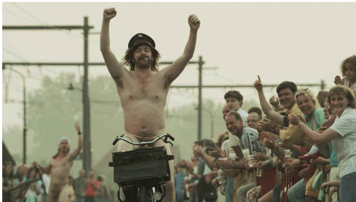
Uit de film 'De helaasheid der dingen' naar het boek van Dimitri Verhulst

Deelnemers aan de elf CODL-werkgroepen inventariseren vertalingen en andere bewerkingen van de ca-