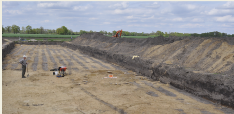
Opgraving van een grafveld en een herenhof in Vasse (Tubbergen)

RAAP Archeologisch Adviesbureau heeft in 2012 en 2014 opgravingen uitgevoerd op de locatie De Steenbri 3 te Vasse in de gemeente Tubbergen. Daarbij zijn niet alleen palenrijen, -kransen en zeer bijzondere grafmonumenten met bijgiften uit de prehistorie aangetroffen, maar ook de resten