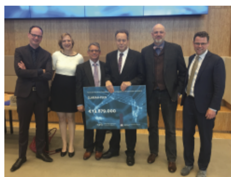
€13,8 miljoen voor CLARIAH PLUS. Credits NWO

NWO heeft in het kader van de Nationale Roadmap voor Grootschalige Wetenschappelijke Infrastructuur €13,8 miljoen toegekend aan het project CLARIAH PLUS. Dit project is een voortzetting van het CLARIAH CORE-project, waarin de afgelopen vier jaar de basis is gelegd voor een digitale infrastructuur voor de geesteswetenschappen. CLARIAH-CORE focuste speciaal op taalkunde, sociaal-economische geschiedenis en mediastudies. In CLARIAH-PLUS worden daar disciplines aan toegevoegd die zich bezighouden met tekstinhoudelijke analyses, zoals letterkunde, geschiedenis, filosofie en theologie. Namens een nationaal consortium van universiteiten en geesteswetenschappelijke instituten nam