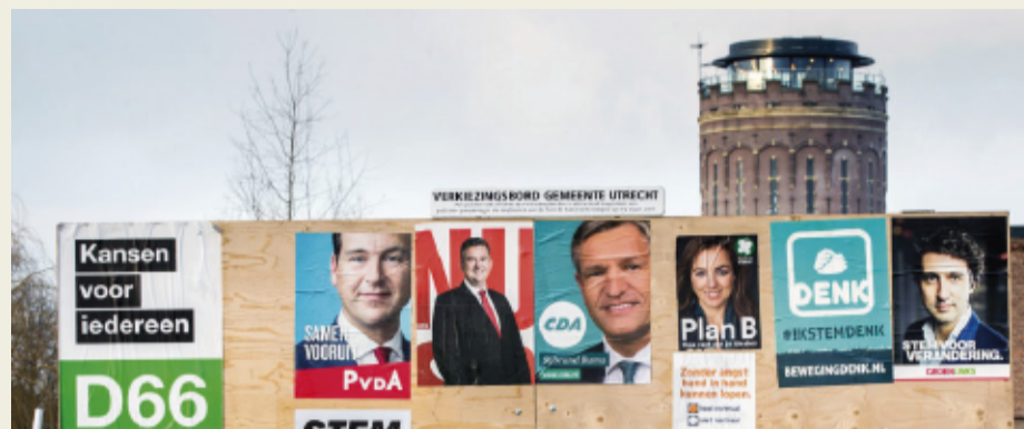
Verkiezingsbord Utrecht

Deze bestanden zijn kosteloos beschikbaar via lissdata.nl/dataarchive . Bezoek deze site of scan de QR-code.