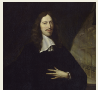
Portret door Jan de Baen van Johan de Witt, raadpensionaris van Holland.

Onlangs stelde het Huygens Instituut zeventienduizend brieven van Johan de Witt online beschikbaar. Het zijn de eerste brieven afkomstig uit een compleet archief van de diplomatieke correspondentie van de raadpensionaris, beheerd door het Nationaal Archief. De overige 28.000 brieven zullen de komende jaren aan deze online catalogus worden toegevoegd. Het betreft correspondentie uit de periode tussen 1649 en 1672 uit heel Europa. De brieven zijn vooral afkomstig van diplomaten en geschreven in het Nederlands, Frans, Engels en Latijn. Ze worden ontsloten in samenwerking met het Nationaal Archief, Oxford University en de Bodleian Library. (MJ) huygens.knaw.nl