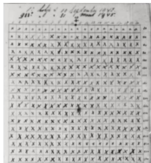
Het echtpaar Weyel hield onder andere het aantal ondergedoken dagen bij.

Op blog.ehri-project.eu staan tientallen voorbeelden van toepassingen van digitale technieken en gebruik van gedigitaliseerde archiefbronnen om bestanden te digitaliseren, te documenteren en online beschikbaar te stellen.