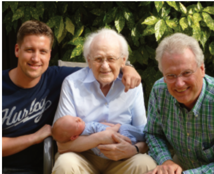
De databank van SHARE bevat gegevens over de leefsituatie van 50-plussers in Europa.