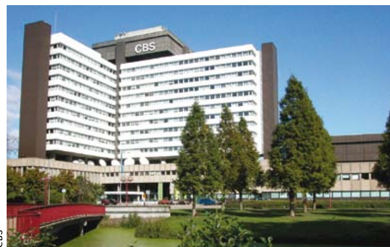
Het CBS-gebouw in Voorburg

voor een serie andere variabelen, zoals aantal auteurs, aantal publicaties van de auteurs, land van herkomst, discipline, etc. De studie bevestigt het vermoeden van de voorstanders: OA artikelen worden tweemaal zo vaak geciteerd als niet-OA artikelen. Voor wetenschappers lijkt het dus verstandig te publiceren op basis van Open Access.