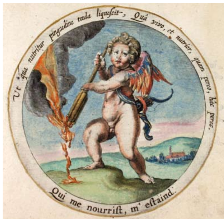
Zoals een fakkel door het vet waarmee hij gevoed wordt, zo kom ik om door wie ik leef en wordt gevoed en door degene op wie ik smoorverliefd ben. Uit: Daniel Heinsius, Emblemata amatoria (c. 1601), met dank aan de Universiteitsbibliotheek UvA.