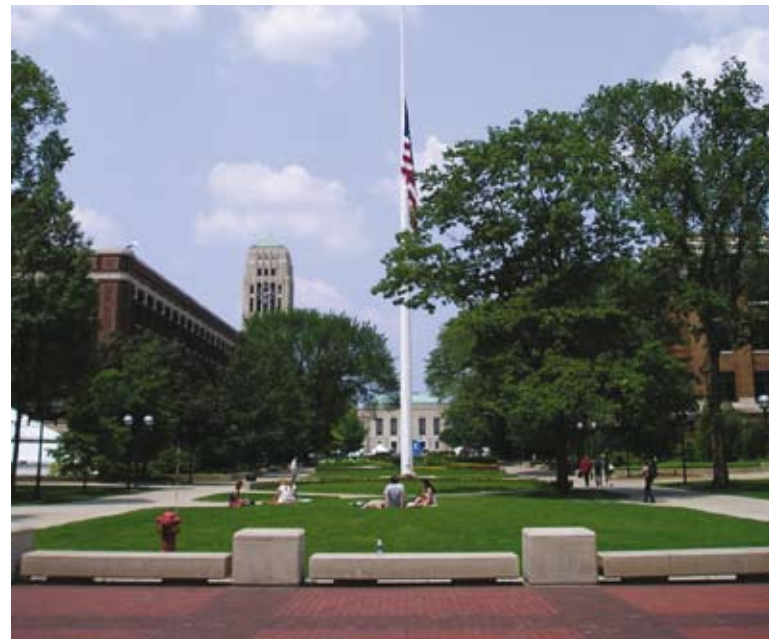
Een rustige zomer in Ann Arbor

Elke zomer organiseert het Inter-university Consortium for Political and Social Research (ICPSR) een programma over kwantitatieve methoden in sociaalwetenschappelijk onderzoek, de summer school aan de University of Michigan. Deelname, door studenten, promovendi en onderzoekers uit alle windstreken, is bijzonder leerzaam en daarnaast leuk en nuttig. Dit jaar waren er maar liefst twaalf deelnemers uit Nederland.