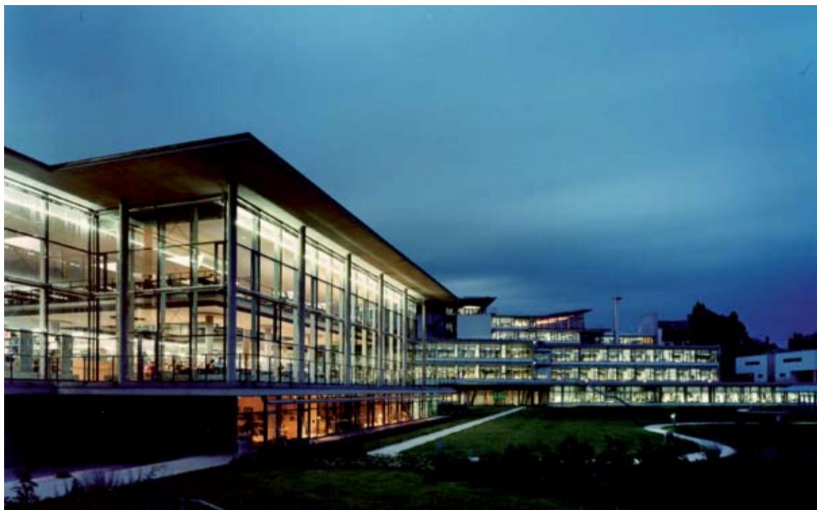
DIE DEUTSCHE BIBLIOTHEK

Op de conferentie zochten mensen met zeer diverse achtergronden vanuit zowel de traditie ('first life') als de nieuwe computergestuurde toepassingen ('second life') naar de elementen die games en simulaties effectief maken. Uit diverse bijdragen bleek dat een belangrijk element van traditionele toepassingen is dat gewerkt wordt met één of meer facilitators die het proces begeleiden, sturen, feedback geven en reflectie uitlokken. Bij computertoepassingen ontbreken deze meestal en moet de computer deze taken overnemen. Dit is echter niet zo eenvoudig. Er blijken nog weinig richtlijnen te zijn voor elementen die in educatieve computergames het leren kunnen ondersteunen. Feedback is in veel games vaak te beperkt en alleen op